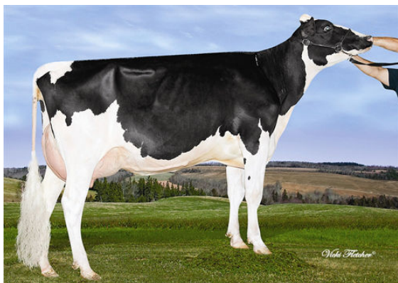
AMITIES MAN O MAN LOVER MARY Dam